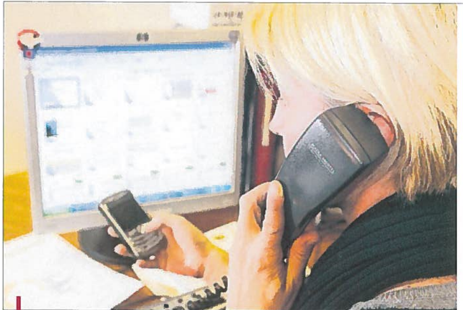
Le travail en temps partagé permet aux jeunes de se forger une expérience et aux seniors de trouver une solution pour rester sur le marché du travail, les entreprises engageant ponctuellement des cadres expérimentés.

Le principe est simple: bon nombre d'entreprises ne peuvent pas embaucher un "35 heures" car elles n'en ont ni les moyens, ni forcément le besoin. En revanche, regroupées, elles peuvent acquérir les compétences de salariés à temps complet et se le partager. De leur côté, les salariés peuvent envisager d'autres horizons que celui du temps partiel. Aujourd'hui, en France, 1,2 million de personnes sont employées à temps partagé, dont 210 000 cadres. La formule concerne toutes les catégories à l'exception de la fonction publique: de la direction générale au secrétariat, en passant par les ressources humaines. Les contrats se découpent en demi-journée, journée ou en semaine. Il existe des groupements d'employeurs, des associations ou des entreprises de travail à temps partagé. Cette formule n'est pas réservée aux seu-